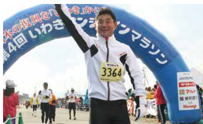
いわきサンシャインマラソン完走!

医療人材に選んでもらえるような、魅力的で躍動感があふれる 街づくりをします。高齢者や将来世代が、安心して暮らせる救急 医療・高度医療を実現します。